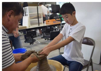
再開した事業所：地域の伝統文化