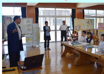
二本松の祭を学ぶ