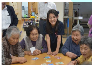
仮設住宅でのカルタの交流