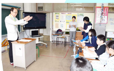
復興十日市祭の講話